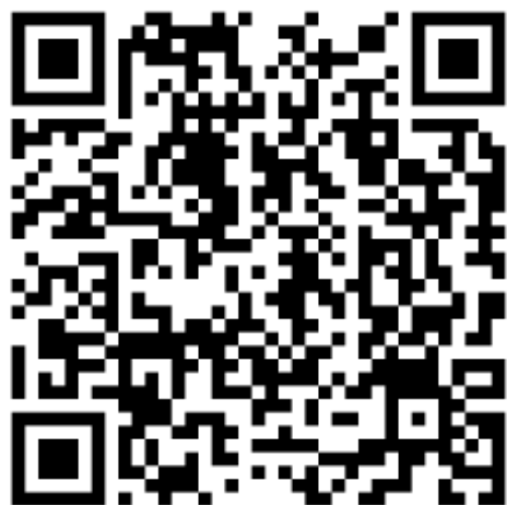
Vidéo le matériel nécessaire au dressage du plateau