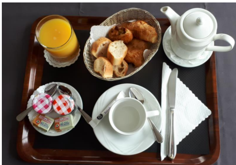
Plateau de petit-déjeuner continental

Vidéo les produits du petit-déjeuner continental